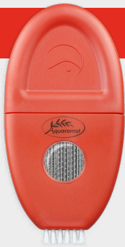
Do każdego typu włosów