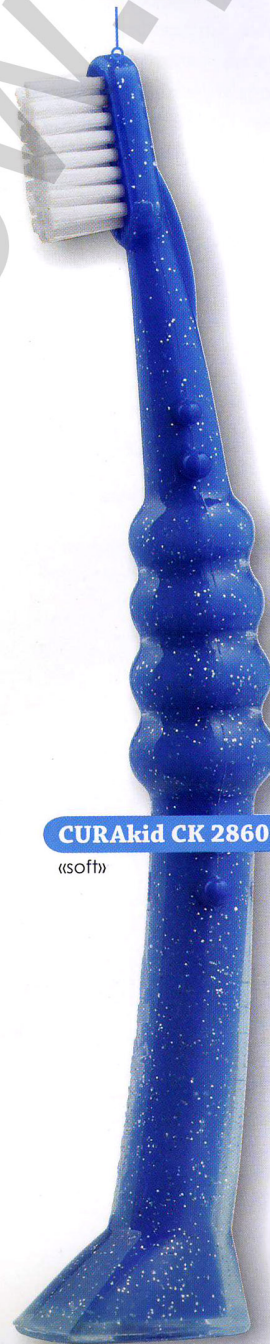
CURAkid CK 2860 «soft»