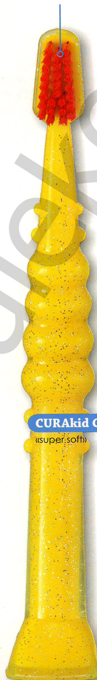
CURAkid CK 3860 «super soft»

Prawidłowy kształt główki szczoteczki pozwala na dokładne umycie każdego zakamarka w jamie ustnej